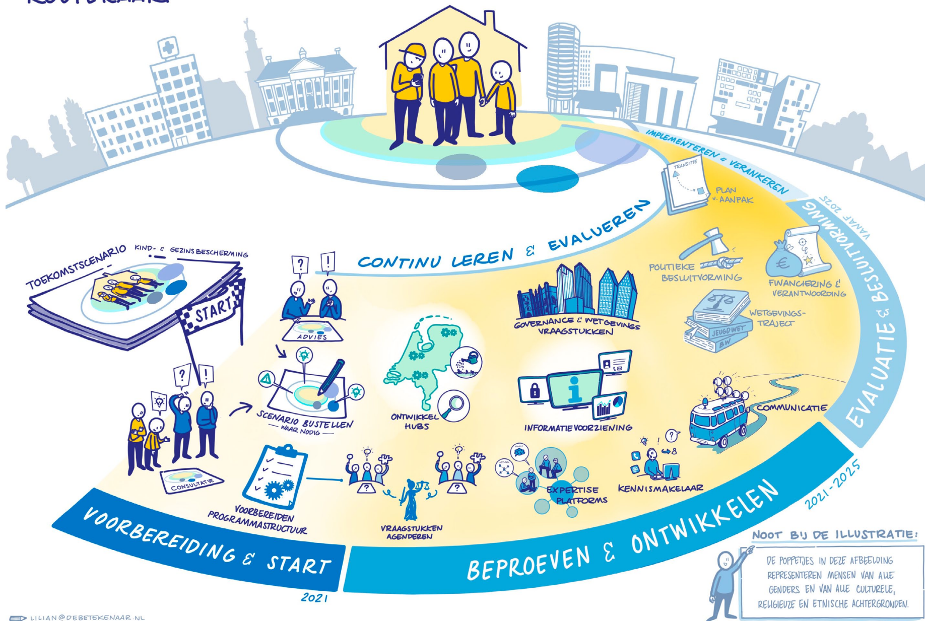
Afbeelding 2 - De routekaart